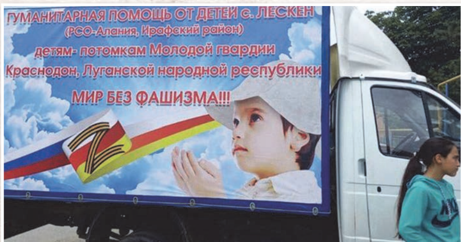
Абони дæр, дуйней сабурдзийнадæ тæссаг уавæри ку æй, Уæрæсе уодфеда- рæй ку тох кæнуй нуриккон нацизми нихмæ, уæд бабæй лескейнагтæ дæр еуварс нæ 'нцæ, ци гæнæн æма амал ес, уомæй агъаз кæнунцæ сæрмагонд æфсæддон операций архайгутæн.