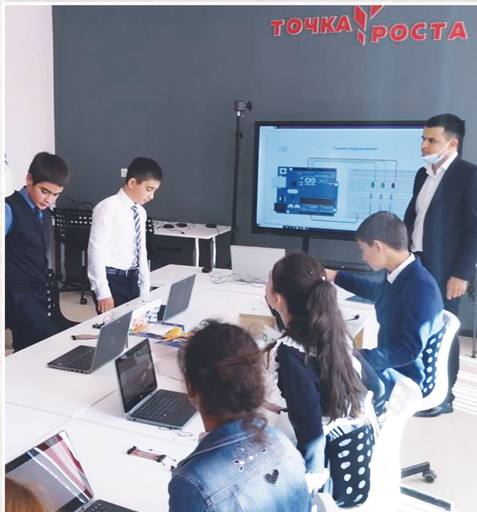
Абони скъолай еугур, тæккæ нуриккондæр равгитæ æма гæнæнтæ ес, цæмæй скъоладзутæ æнтæстгинай ахур кæнонцæ, æнхæстæй райсонцæ гъæугæ зонундзийнæдтæ.