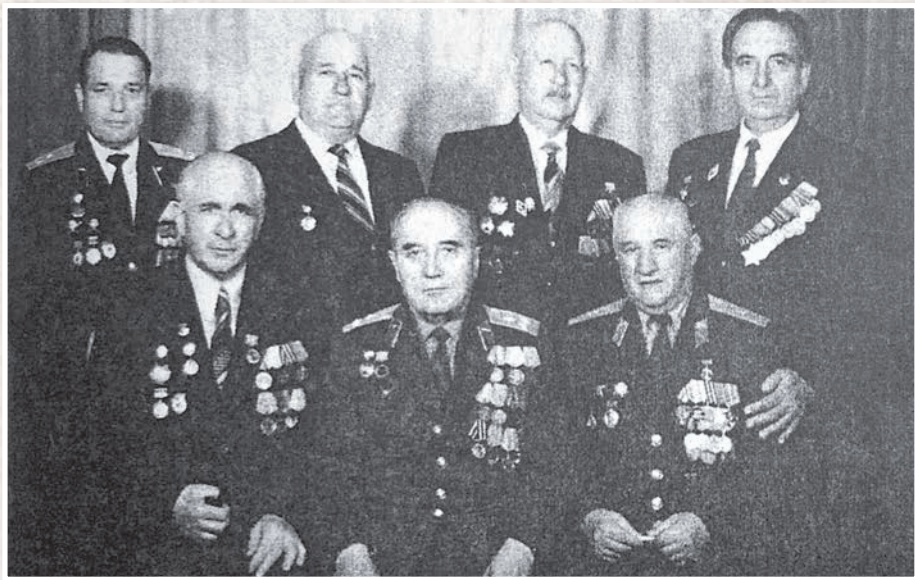
Устур Фидибæстон тугъди ка архайдта, еци лескейнаг тугъдонтти къуар.

Тæходуй, ескæд бони ду кæмæй зæгъдзæнæ, мæн æй, зæгъгæ!. Ду ке исаккаг кæндзæнæ дæ- хецæн æма ке ниттохдзæнæ дæ гъар гъæбеси!. Тæходуй, дæ зарæги ку ракæнисæ мæ кой, дæ гъарæнги ку райгъусидæ мæ ном!. Абони æргомдзурд дæн, фиццаг æма фæстаг хатт, æма 'й зæгъун, уадзæ е ба 'й еугурдæр зононцæ дæ кæдзос, дæ кадгин ном, мæ хъазар, ке некæд некæбæл байивдзæнæн, еци уарзон... Мæ Райгурæн бæстæ!..»