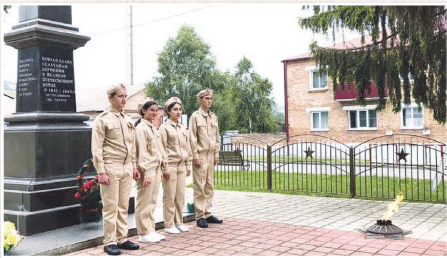
Устур Фидибæстон тугъди рæстæг сæ цард Райгурæн бæсти сæрбæлтау ка иснивонд кодта, уони номерæнæн Лескени æвæрд ес циртдзæвæнтæ. Ирæз- гæ фæлтæртæ син цитгин кæнунцæ сæ рохс нæмттæ.