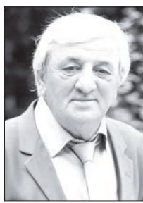
КОЛИТИ ВИТАЛИ, Уæрæсей финстути Цæдеси иуонг

Цийфæнди гъæубæстæ дæр иннети рази æхе цитгийнæгдæр кæнуй æ циуавæрдæр сæрустурдзийнæдтæй. Уæлдайдæр ба æ гъæукæгти рауон-циуондзийнæдæ æма лæгдзийнæдтæй. Еугæр уотæ 'й, уæд лескейнагтæмæ зингæ фулдæр разиндзæнæй, сæрустур кæмæй æма цæмæй æнцæ, уæхæн дæнцйтæ.