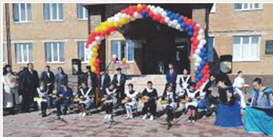
Лескени гъæубæсти сæрустурдзийнæдтæй еу æй сæ астæуккаг скъола. Дæсгай æма дæсгай æнзти дæргъи гъæуи кæстæрти цал æма цал фæлтæри фæррæ- ствæндаг кодта сæ царди нæдтæбæл ранæхстæр уогæй. Мæнæ дæлдæр ке мухур кæнæн, еци къари уинетæ скъолай раздæри рауагъдонтти.