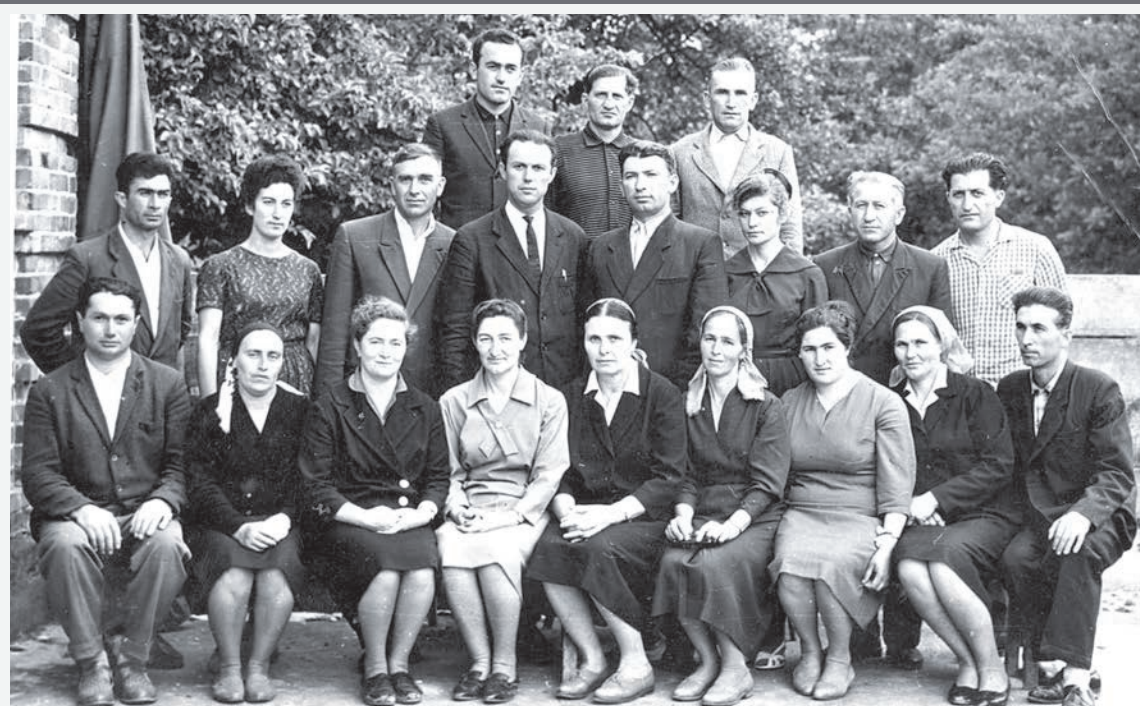
Лескени фæсæвæд алкæддæр тулаваст адтæнцæ æма нерæнгæ дæр æнцæ ахуради гъуддæгутæмæ. Æма сæ уомæ ба фиццæг разæнгæрдгæнгутæ исунцæ гъæуон скъолай ахургæнгутæ. Раздæр рæстæуги скъолай косæг ахургæнгуги еу къуар уинетæ аци къари дæр.