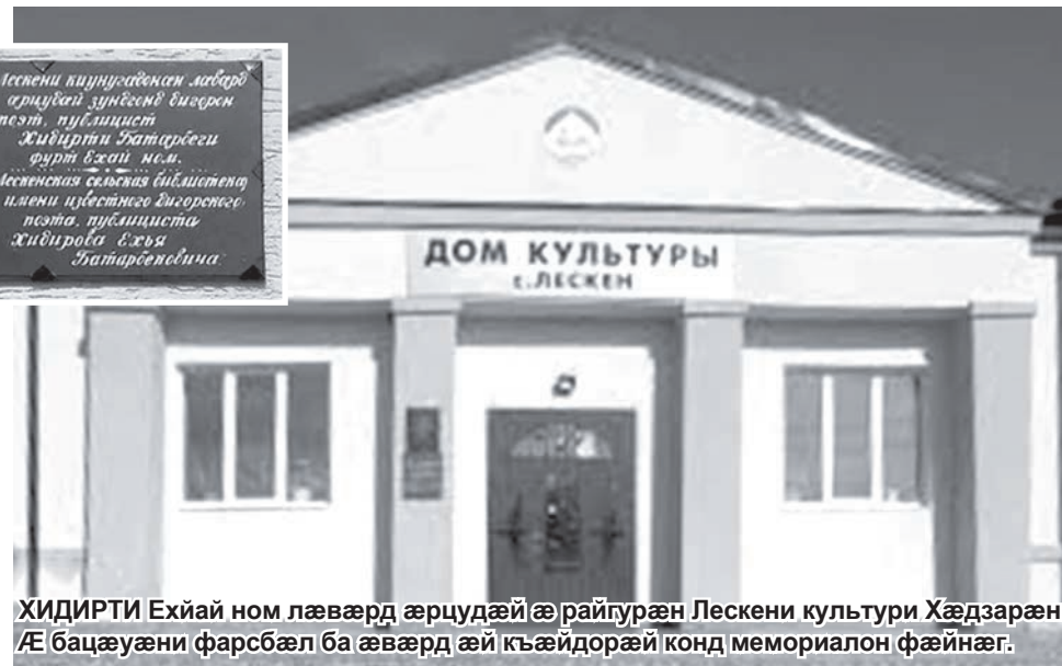
ХИДИРТИ Ехйай ном лæвæрд æрцудæй æ райгурæн Лескени культури Хæдзарæн. Æ бацæуæни фарсбæл ба æвæрд æй къæйдорæй конд мемориалон фæйнæг.

Нуртæккæ «тугъди сувæллæнтæ» ке хонунцæ, еци фæлтæрмæ хаудтæй Хидири- фурт дæр. Тугъд сæ æрæйафта сæ тæк- кæ ирæзунæ рæстæг. Уомæ гæсгæ ба еци уæззау бонти хуæрз æстæнтæй уæлдай сабийдоги амондадæ неке бавзурста поэти æмдогонтæй. Æ къохмæ къæпе райсунгъон кадæриддæр адтæй, етæ сæ еугурдæр ку- стонцæ еумæйаг хæдзарæди.