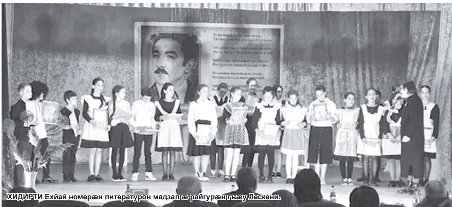
ХИДИРТИ Ехйай номерæн литературон мадзалæ райгурæн гъæу Лескени.