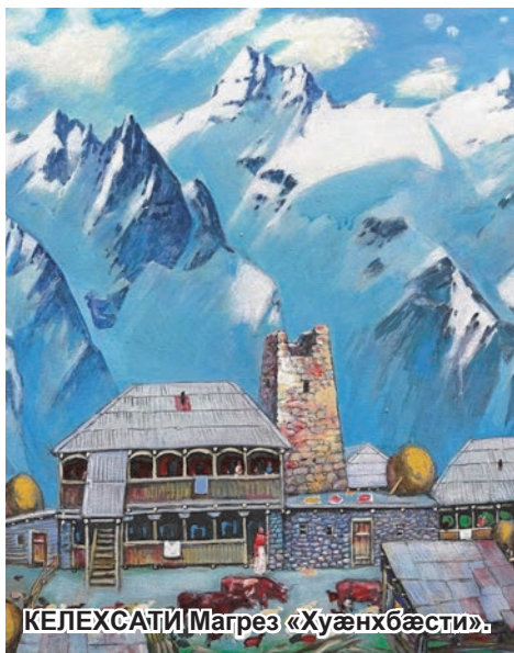
КЕЛÆХСАТИ Магрез «Хуæнхбæсти».

Топпæй фехсгæй тæхгæ фатæн Фæстæмæ 'здæхæн нæйис, Мæ евгъуд царди ме 'фсардæн Райевæн нур нæбал ес.