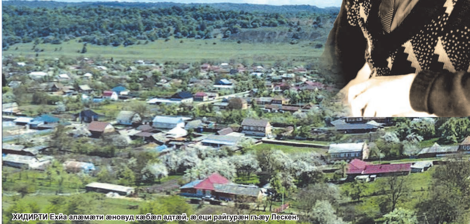
ХИДИРТИ Ехйа алæмæти æновуд кæбæл адтæй, æ еци райгурæн гъæу Лескен.

Хидирти Ехйа е 'мдзæвгитæй еуеми («Сауæдонæ») уотæ финста: