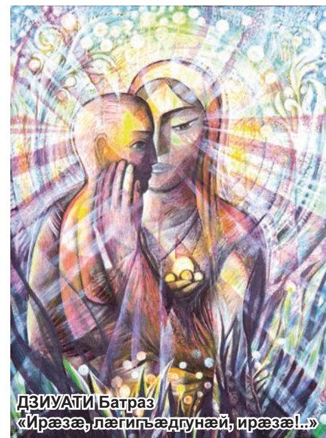
ДЗИУАТИ Батраз «Ирæзæ, лæгипъæдгунæй, ирæзæ!...»

Мади уарзтæн ци 'й æ цори Е цъæх денгиз, е цъæх арв? Ци 'й æ цори зæнхи къори, Кæд æма молуй зинг хори, Æ уарзтæй тавгæй, йе мах?