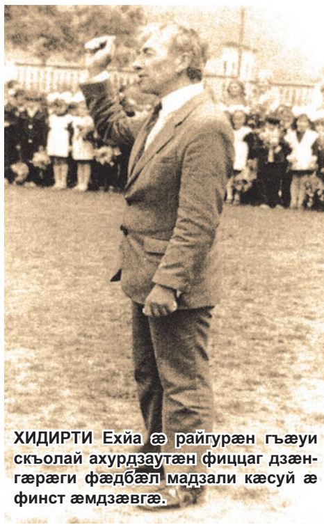
ХИДИРТИ Ехйа æ райгурæн гъæуи скъолай ахурдзаутæн фиццаг дзæнгæргæй фæдбæл мадзали кæсуй æ финст æмдзæвгæ.

Ку нæ лæууй æгириддæр Размæ ледзгæй нæ рæстæг, Адæймагæн кæддæриддæр Æ йадзал, гæнгæй, хæстæг!