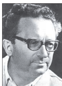
Лев ОЗЕРОВ (1914-1996), поэт, тэлмацгэнэг

СЦКП-йи разамундэй никки устурдэр кьахдзэфтэ ракэндзээнэй Цэгат Иристони Советон Социалистон республикэ Ленини амунд надбэл, никки устурдэр аэнтэстдзийнэдтэ бафтуйдзээнэй а кьохи. Уоман ама ци надбэл цэуэй, е ирээти фэндаг аэй!