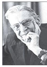
Всеволод РОЖДЕСТВЕНСКИЙ (1895-1977), поэт, тэлмацгэнэг

Лев Озеров бэрэгбони саламтэ лэвардта Иристони фэллоинэггэнугтаэн аэрвэтгэй гэггэдибэл, уой дэр кэдзос иронау ниффинста: «Мэ ирон хэллэрттэ, рэсугд бэрэгбэнттэ уэбэл цэууэд алкэддэр! Нэ хэллардзийнадаэ кэнаэд никки фэдэрдэр!»