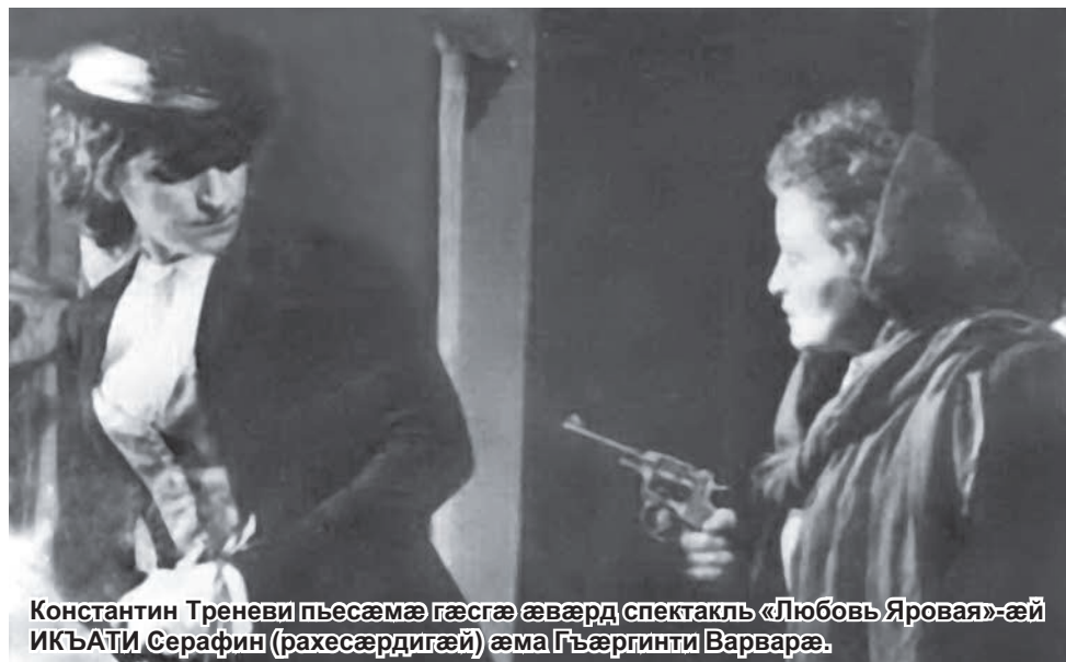
Константин Трениви пьесæмæ гæсгæ æвæрд спектакль «Любовь Яровая»-æй ИКЪАТИ Серафин (рахесæрдигæй) æма Гъæргинти Варварæ.