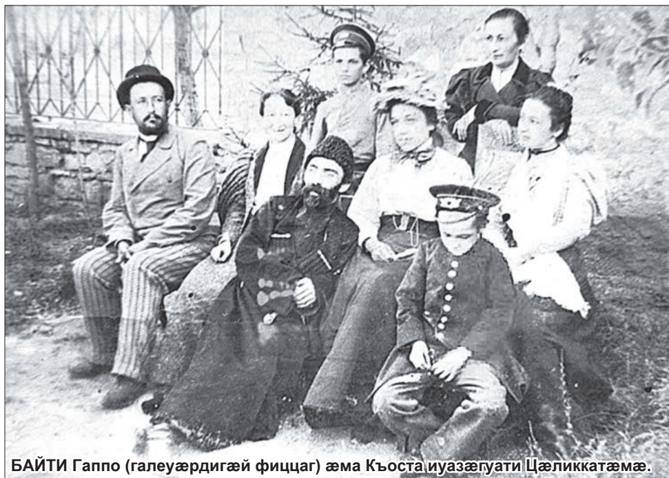
БАЙТИ Гаппо (галеуæрдигæй фиццаг) аема Къоста иуазæгуати Цæликкатæмæ.