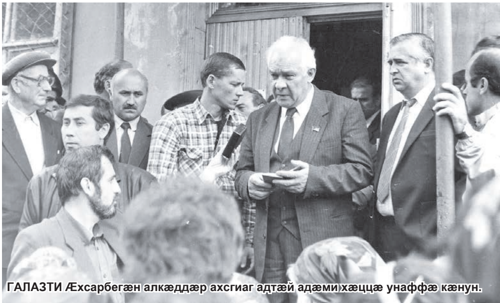
ГАЛАЗТИ Æхсарбегæн алкæддæр ахсгиаг адтæй адæмихæццæ унаффæ кæнун.