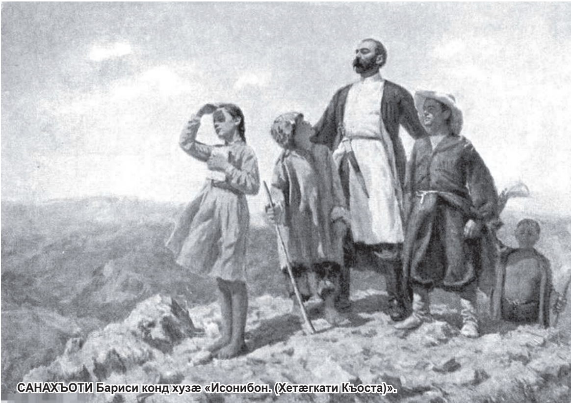
САНАХЪОТИ Бариси конд хузæ «Исонибон. (Хетæгкати Къоста)».