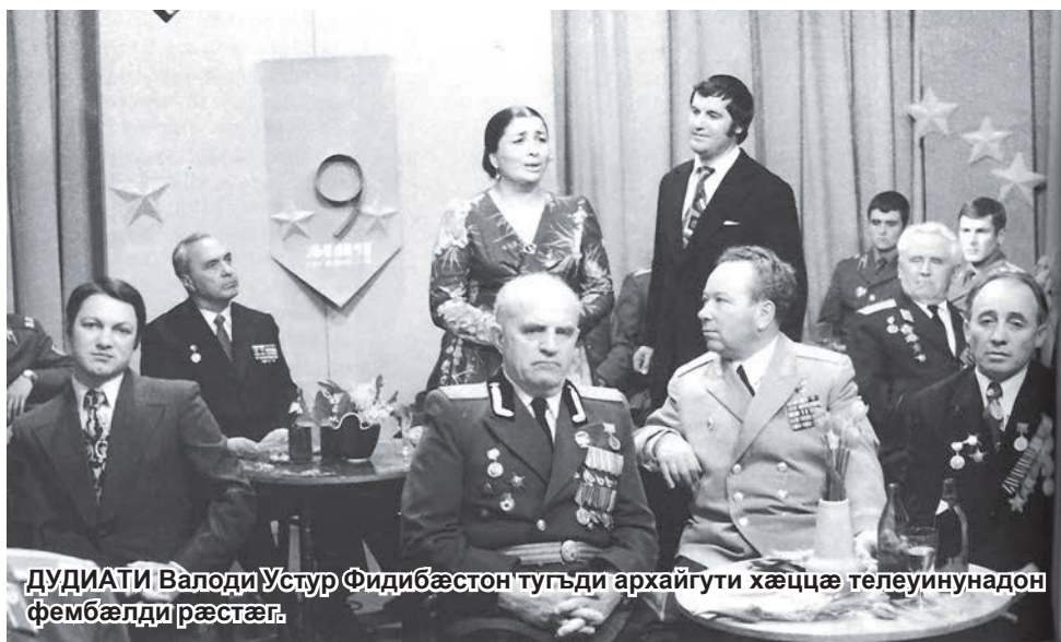
ДУДИАТИ Валоди Устур Фидибæстон тугъди архайгуй хæццæ телеуинунадон фембæлди рæстæг.