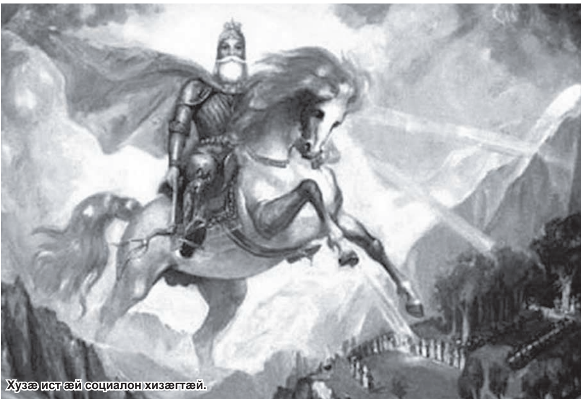
Хузæ ист æй социалон хизæгтæй.