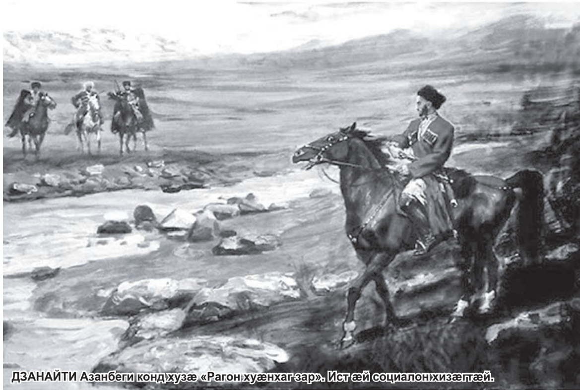
ДЗНАЙТИ Азанбегии кондихузæ «Рагон хуæнхаг зар». Ист æй социалон хизæгтæй.

дзамани историон материализм ахур кодтан æма зонæн: æууæлтæ ку нæма исæвзуронцæ, уотемæй ку райса пролетариат хæцаудзийнадæ, уæд додойаг æ сæр æй. Додойаг разиндтæнцæ уруссаг адæм. Уæрæсе дууæ дехи фæцæй – сурхитæбæл æма уорситæбæл. Нуртæккæ уорситæ хуайунцæ сурхити, ка 'й зонуй, сауæнгæ сæ Мæскуй уæнгæ фæттæронцæ. Уæдта бабæй гæнæн ес, æма сурхитæ сæ гъæлæси рахæссонцæ уорсити. Еци тох кæдмæ цæудзæнæй, уомæн ка ци зонуй? Урус фондзинсæй миллиони 'нцæ. Дæс миллиони си ку фæгъгъæуа, уæддæр ма дæс æма цуппаринсæй миллиони байзайдзæнæнцæ. Махæй ба мин ку фæгъгъæуа, уæддæр нæбæл хъæбæр фæззиндзæнæй. Нæдæр уорситæ, нæдæр сурхитæ хуарзæй неци æрхæсдзæнæнцæ махæн. Уорсити хæццæ нæ гъуддаг нæ рацæудзæнæй – хуæнхаг адæмтæн цагъарæй æндæр неци æрхæсдзæнæй. Мадта нæ карнæ большевикти