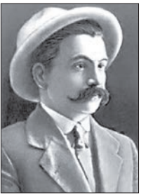
ЦÆЛИККАТИ АХМÆТ (1882–1928) финсæг, публицист