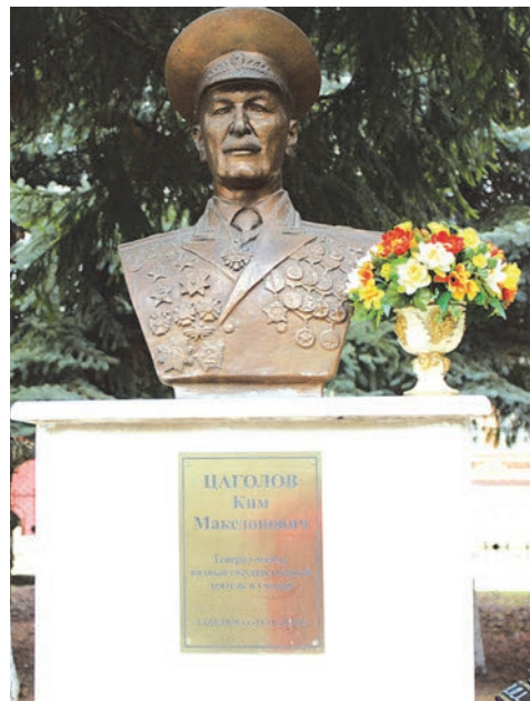
ЦЭГОЛТИ Кими бюст ае райгурээн Киристонгэуи Намуси Аллейи.