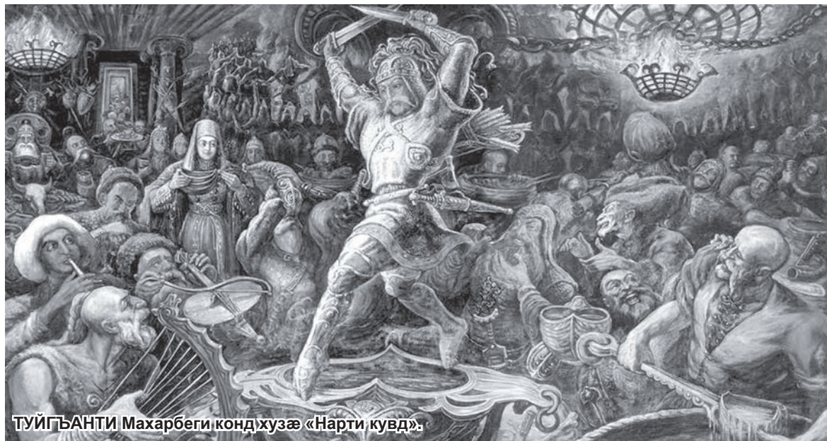
ТУЙГЪАНТИ Махарбеги конд'хузæ «Нарти кувд».

Гардани-фурт æ киунуги цубурæй дзоруй 1905-1907 æнзти цаути туххæй: «Иристони адæми æрлæуун гъудæй, кенæ сæ ка бастыгъта æма сæ æнæ хæдзарæ ка фæккодта, уони æма буржуазий фарс, кенæ ба уруссаг пролетариати фарс. Ке зæгъун æй гъæуй, фæллойнæгæнæг Иристон рацудæй дуккаг надбæл, уруссаг пролетариати фæдбæл æма ин фадут фæцæй сурх турусай хæццæ æ бартæбæл тох кæнун...»