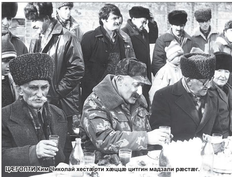
ЦЭГОЛТИ Ким Чиколой хэстэрти хэццэ цитгин мадзали рэстэг.