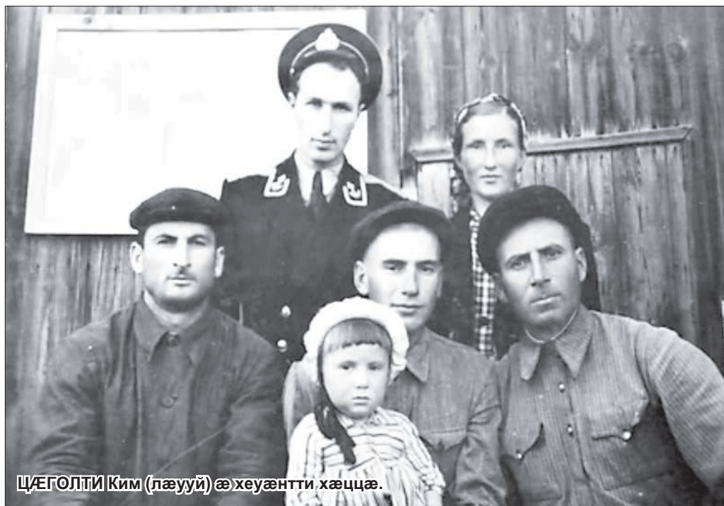
ЦЭГОЛТИ Ким (лэууй) ае хуээнти хэццэ.