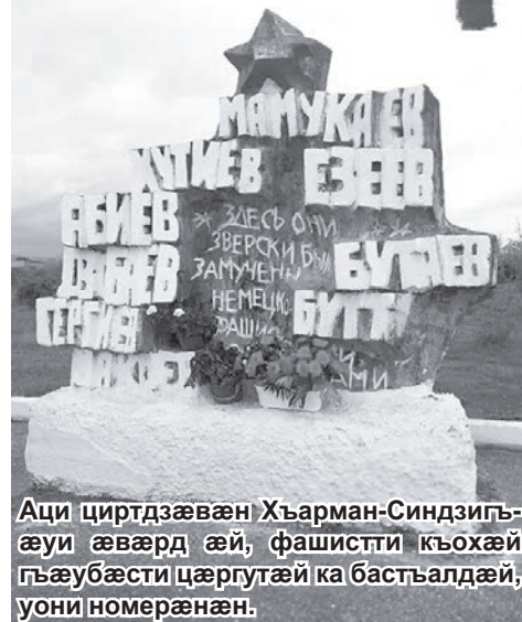
Аци цирдзæвæн Хъарман-Синдзигъæуи æвæрд æй, фашистти къохæй гъæубæсти цæргутæй ка бастгъалдæй, уони номерæнæн.

Æма бабæй Дзафи æ дзубанди идарддæр кæнуй. Дзоруй махæн æ хабæрттæ. Махмæ еуæй-еу хатт уотæ фæккæсуй, цума