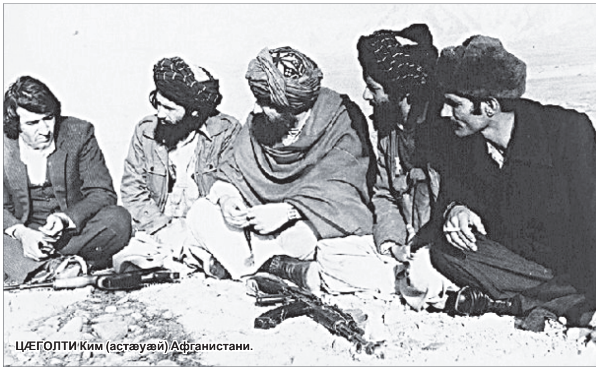
ЦÆГОЛТИ Ким (астæуæй) Афганистани.

Фæстаг хатт ма 'й автор фæ- ууидта афгайнаг æфсади капи- тани дарæси. Æнæ бецъотæй æма цубур æлвуд сæригъунтæй, уотемæй цума еу-дæс анзи кæ- стæрхуз зиндтæй. Революций идеалтæ æ зæрдæмæ хæстæг райсгæй, æ фарс ислæудтæй, æ адæми хæццæ, æма тох кодта контрреволюций тухти нихмæ. Цæггол-Ахмат ба иссæй тæккæ цитгиндæр иуазæг Маланги ба- тальони.