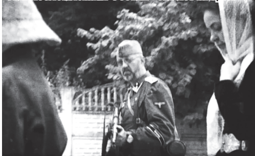
Документалон кинонива «Без срока давности. Несломленная Осетия»-æй исткъарæ.

Ирæфи райони ци къамис архайдта, уой иуонгтæй еу адтæй финсæг Бесати Тæзæ дæр. Е уæди рæстæги ци документалон æрмæг бацæттæ кодта, уотæй еу хай мухур кæнæн абони номери 6-7-аг фæрстæбæл.