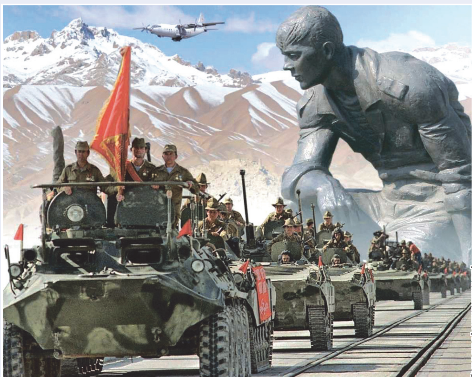
Къарæ ист æй социалон хизæгтæй.

Нæ Фидибæстæй еуваргонд рауæнти тугъдон цаути не 'фсæддонтæй ка архайдта, æма си æ ихæс рæстуодæй æнхæст кæнгæй ка фæммард æй, уони номерæнæн Уæрæсей алли анз дæр 15 феввали бæрæггонд цæуй тугъдонтæ-интернационалистти имисæн Бон. Аци бон ба уомæ гæсгæ нисангонд æрцудæй, æма евгъуд æноси 80-аг æнзти Афганистани зæнхæбæл тугъдтити ка архайдта,