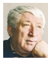
Расул ГАМЗАТОВ (1923-2003) Дагестани адæмон поэт

Национ хелæдæрундзийнадæн национ æвзæгтæй хецæнгæнæн нæййес. Ескæци æвзаг ку рамæла, уæд рамæлдзæнæнцæ адæм дæр (куд хецæн этнос). Бустæги хуæдхуз ка 'й, хуæндбундор кæмæн ес, уæхæн адæмтæ мæлонцæ, е ба ке бафæнддзæнæй? Неке, æ сæрæй æ къæхти уæнгæ расист ка 'й, айдагъ уæхæнтти.