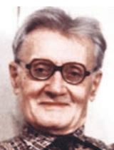
АБАЙТИ ВАСО (1900-2001) номдзуд ахургонд

Уогæ, ка 'й зонуй, иннетæ уотæ дæр æнгъæлунцæ æма маддæлон æвзаги сæрбæл айдагъ мах ан сæрбæлдзорæг. Баруагæс уи уæд, дуйней иннæ адæмихæттити дзурдзæугæдæр адæймæгутæн дæр сæ маддæлон æвзаги карнæ сагъæссаг æй, зæрдиагæй дзорунцæ æма архайунцæ, цæмæй си алкæмæн дæр æ маддæлон æвзаг цæра æма æнтæстгинæй ирæза. Дæнцæн уин æрхæдсдинан уонæй еуæй-еуети гьудитæ.