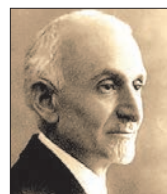
Ованес ТУМАНЯН (1869-1923) сомегах поэт

Кæмæндæрти кедæр æвзаг – æвдадзау, Нивæндунцæ ибæл зæрдæрайгæ сæ зард. Кæд исон æрцæудзæнæй ме 'взагæн æ адзал, Уæд нæбал гъæууй мæн абони дæр мæ цард.