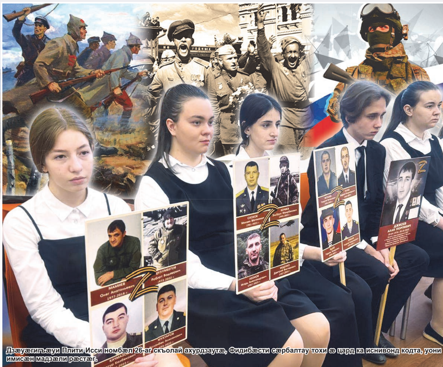
Дзæуагигъæуи Плити, Исси номбæл 26-аг скъолай ахурдзаута, Фидибæсти сæрбалтау тохи æ цард ка иснивонд кодта, уони имисæн мадзæли рæстæг.

Æнæгъæнæ Уæрæсей дæр исон, 23 феввали бæрæггонд цæудзæнæй Фидибæстæ гъæуайгæнæги Бон. Аци бæрæгбон æцæгæй еугурадæмон æй, исцитгин æй кæнунцæ куд коллективти, уотæ хецæн бийнонти 'хсæн дæр. Е лæдæрд æй, уомæн æма уæхæн бийнонтæ, æвæдзи, нæ разиндзæнæй, æма си кадæр нæ бахъиамæт кодта Райгурæн бæсти æдасдзийнади сæрбæлтау. Уой фæдбæл æрмæгутæ мухур кæнæн нæ газети абони номери.