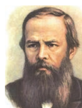
Федор ДОСТОЕВСКИЙ (1821-1881) уруссаг финсæг

Æвзаг æй, алли адæм дæр цæй фæрци цæрунцæ æма 'нцæ, уæхæн ахсгагдæр уедагæ, сæ хуæдбундоради æма генийи ирддæр бæрæггæнæн, истори æма идард кæддæри дзамантæ байгон кæнунæн æмбесонди дæгъæл, уоди гъæздугдзийнæдтæн, ес бонтæн сæ тæккæ ахедгæдæр, фæрнгундæр, цæвæттонгæ, адæмæн сæ уод æма сæ психологи.