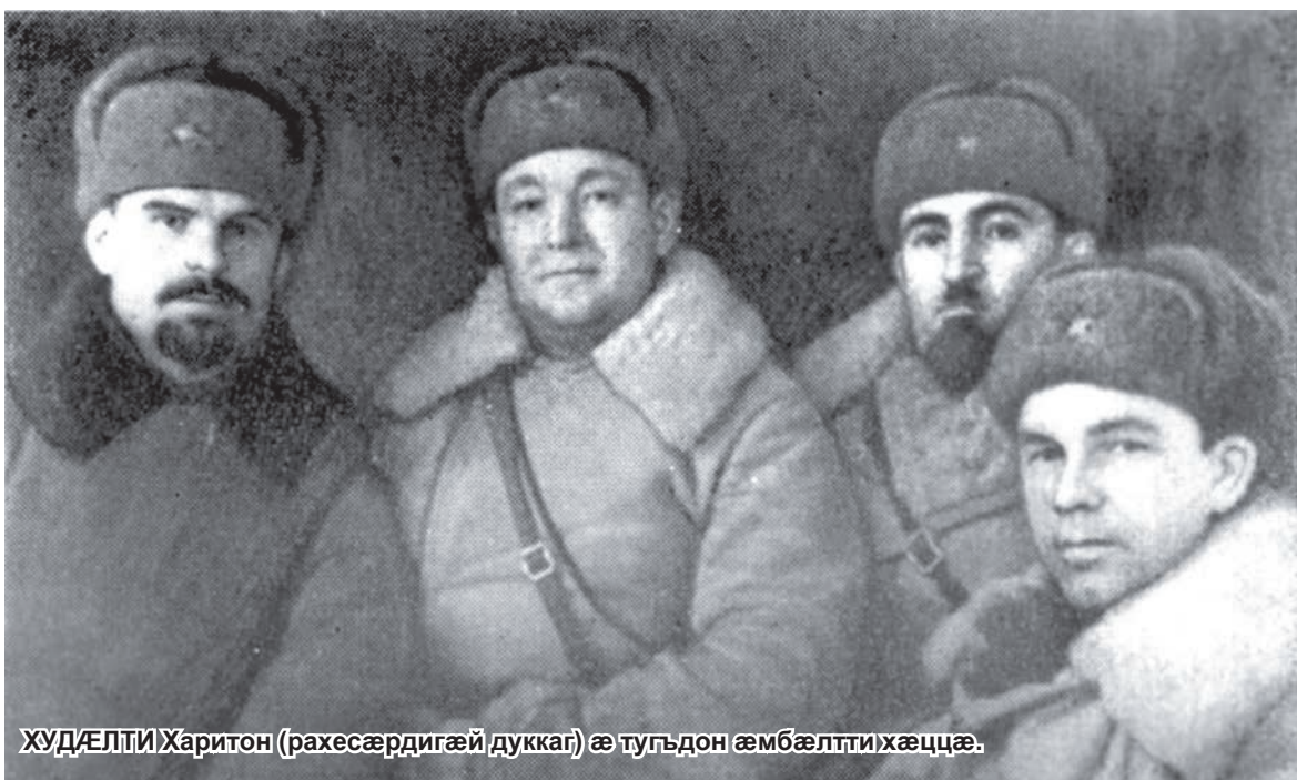
ХУДÆЛТИ Харитон (рахесæрдигæй дуккаг) æ тугъдон æмбæлтти хæццæ.