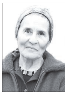
ДЗАБАЙТИ-МАЛИТИ Фузæ, Цæгат Иристони адæмон ахуради æскъуæлхт ахургæнæг: – Æз дæр дæн, мæнæ тугъдон сувæллæнттæ ке хонунцæ, уонæй, æма ма бæлвурдæй гъуди кæнун, тугъди рæстæги хабæрттæ... Уæлдайдæр ба уой, æма цæйбæрцæбæл дзæвæгæрæ мæгур бæнттæ нин æвзæргæ рауадæй. Хестæртæ ци зиндзийнæдтæ æвзурстонцæ, уони кой нуртæкки фæлтæртæн, тугъди хабæрттæ уотид койтæй ка зонуй, ку ракæнай, уæд си, æвæдзи, æруагæс дæр нæ бауод-зæнæй, гъома, уæхæн фудимелатæн куд ес уæн, зæгъгæ...

тан: æстонг, берæ цæмæйдæрти гъæуагæ адтæнцæ ме скъолай, ме студентон ахури æнзтæ. Тугъд ку райдæдта, уæд нæ гъæуей знаги нимæ тохмæ рандæй 800 адæймаги, уонæй аст ба адтæн-цæ кизгуттæ. Еци бæгъатæр адæмæн сæ фулдæри æмбес фæммард æнцæ нæ хъазар бæ-сти сæрбæлтау. Нур дæр ма мæ зæрдæ уæззау ристæй исрезуи, уæд ци берæ седзæртæ æма сед-зæргæстæ иссæй нæ гъæуи, уой æримисгæй.