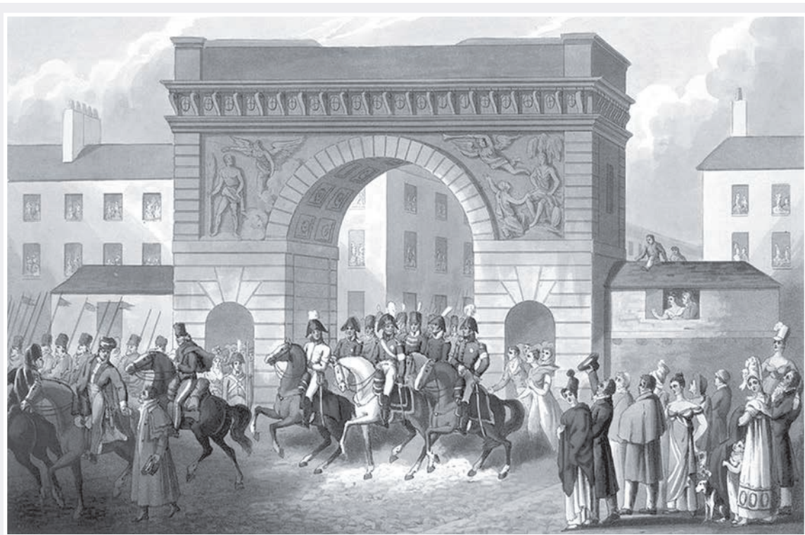
Къарæ ист æй социалон хизæгтæй

Еци «дун-дуйнеяг агъазиу сæррæттæгæн» райдайæн ба æвæрд æрцудæй уартæ сауæнгæ Иван Грозный паддзахеуæг ку кодта Уæрæсей, 1578 анзи немугаг цæстфæлдæхæг Генрих Штаден Уæрæсей æфсади баслужбæ кæнгæй æма Уæрæсей бæстæй фæлледзгæй, æхе бахадта цитгийнæг Ромаг империй император Рудольф Дуккагмæ æхе арæст «Московский империй фæрсæг бæстæ исаразуни пълан»-и хæцæ. Уоми финст адтæй: «Цæмæй Уæрæсей паддзахадæ байахæс-сай æма дæ дæлбарæ бакæнай, уой туххæй гъæуи æдæугурæй 200 науи хуæлцæй ефтонггонд, 200 дзармадзани æма 100 000 адæймаги. Уотæ берæ ба уæрæсейæгги хæццæ истохунмæ нæ гъæунцæ, фал уоми хе гъæугæ хе-цауадæдзийнадæ 'рфедар кæнунмæ. Уæрæсейæггæн фиццагидæр байсун гъæудзæнæй сæ хуæздæр бæхтæ, уой фæсте ба науи нисанеуæгæй сæмæ цидæриддæр ес,