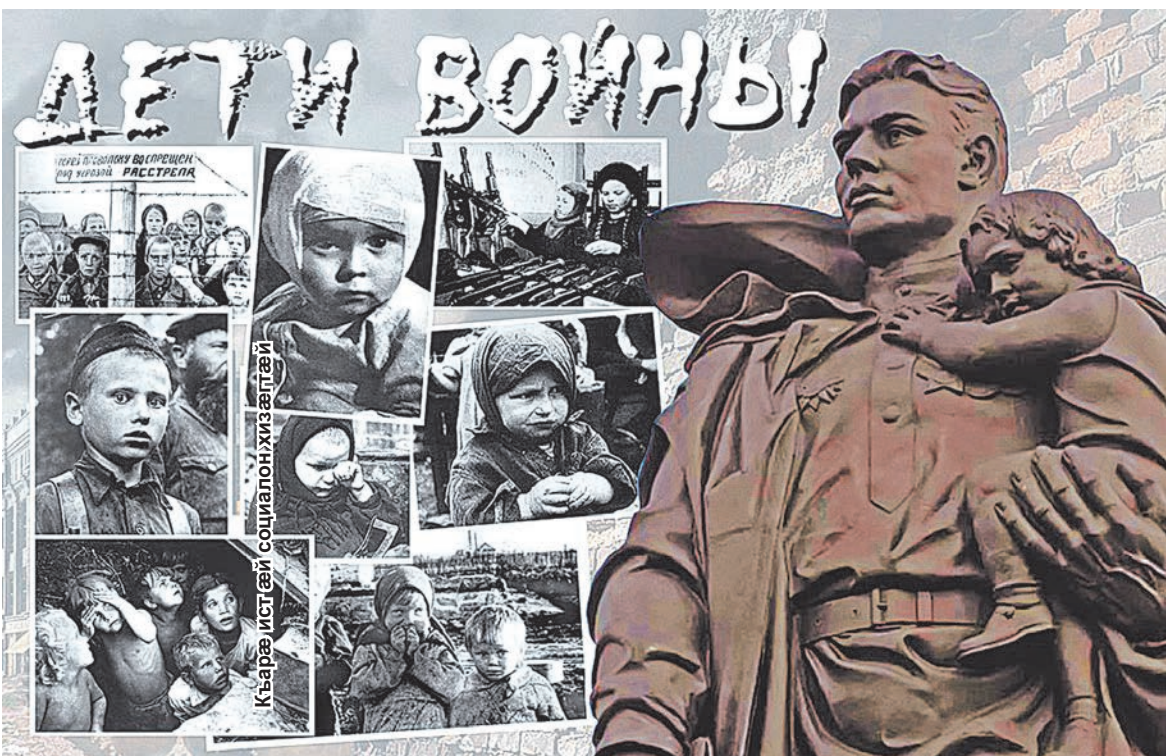
Къарæ ист æй социалон хизæгтæй

Адæм цудæнцæ косунмæ колхози будуртæмæ, белтæй къахтонцæ хумгæндтæ, уæдта си аразтонцæ картоф, нартихуар. Мадта æхсæдунмæ дæр нæ нæ мадтæлтæ фæххонионцæ, æхсастан, кæд нæ бон нæ адтæй, уæддæр. Уотæ тиллæгæфснайæнти рæстæг дæр... Мæнæуæй карстонцæ æхсирфтæй, инайæ ба 'й кодтонцæ молотилкæй, æхсæвæ кодтонцæ еци куст. Бонæй тæвдæ рæстæги 15-16-анздзуд биццеутæ ба тиллæг Æрæдонмæ ластонцæ галтæбæл, талингæй исхъæртиуонцæ сæ кымбус дзæбурти, сæ дивилдун хъæппæлти, паддзахадæн лæвардтонцæ сæ ихæс.