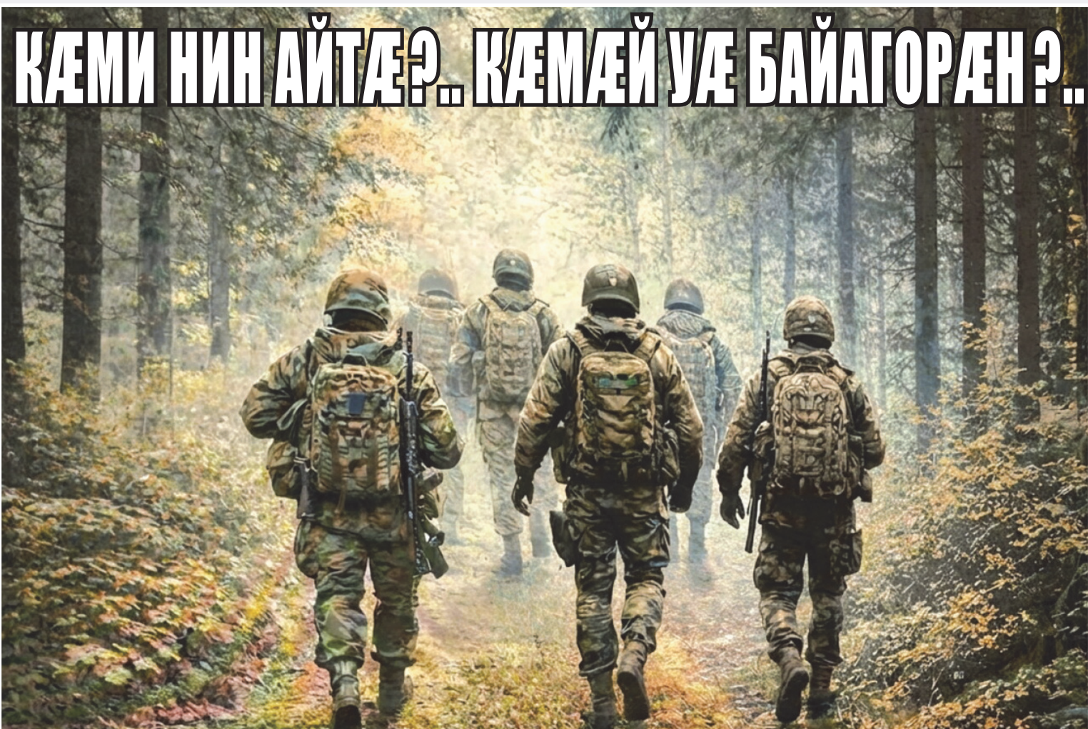
Кæрæв ирт æй социалон хосæлтæй

Æбæрæгæй фесавдæй... Алли тугъд дæр æнæуойдæр æ æверхъаудзийнæдтæй зæрдрист фæккæнуы адæми, фал уæлдай содзаггæ е фæууы, æма сæ тугъдонти ирисхъи фæдбæл ка фæттхусуй, уонæн си, æбæрæгæй фесавдæй, зæгъгæ, ку фегъосун кæнунцæ... Устур Фидибæстон тугъди рæстæг цал æма цал бийнонтемæ исигъусидæ уæхæн уæззау хабар... Цал æма цал нийерæги, седзæргæси, уобæл не 'ууæндгæй æнгъæлмæ кастæнцæ сæ тугъдонти фæззиндмæ... Цал æма си цал гъеуотæ