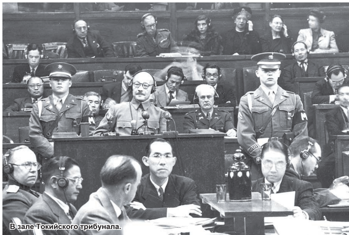
В зале Токийского трибунала.

Российская газета – Федеральный выпуск: №93(9929)