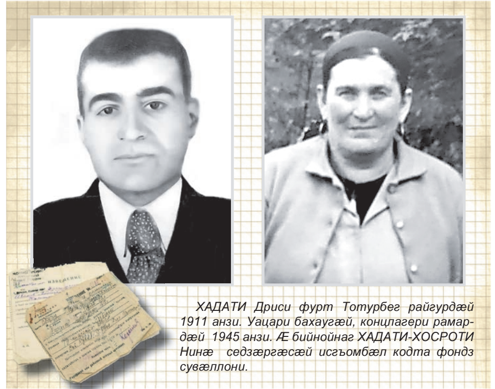
ХАДАТИ Дрисы фурт Тотурбег райгурдæй 1911 анзи. Уацари бахаугæй, концлагери рамардæй 1945 анзи. Æ бийнойнаг ХАДАТИ-ХОСРОТИ Нинæ сæдзæргæсæй исгъомбæл кодта фондз сувæллони.