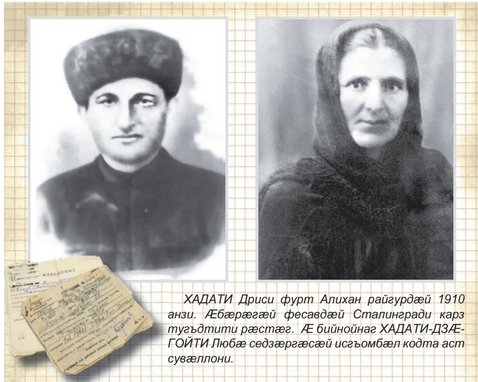
ХАДАТИ Дрисы фурт Алихан райгурдæй 1910 анзи. Æбæрæгæй фесавдæй Сталингради карз тугъдтити рæстæг. Æ бийнойнаг ХАДАТИ-ДЗЕ-ГОЙТИ Любæ сæдзæргæсæй исгъомбæл кодта аст сувæллони.