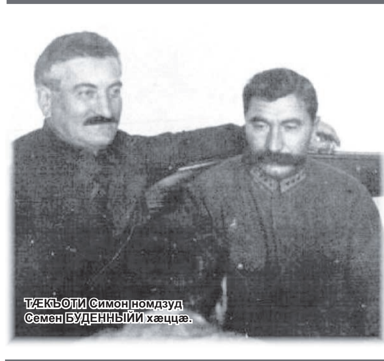
ТЭЖКЬОТИ СИМОН ИНОМДЗУД СЕМЕН БУДЕННЫЙИ ХЭЦЦЭ.

Еци рэстэги бунэетти медэггэ хецэудзийнади оргэнтэ нэбал адтэй. Фехалдэенцэ контрреволюцион нихмэ тох кэунуи дзамани. Уомэ гэгсгэ Симон съезди размэ аэрэвардта округти ревкомтэ исаразуни фарста. Съезд исарази аэй еци фэндонбэл. УКП(б)-ий «Кермен»-и Цэгат Иристони Центрон Комитет исаразта Цэгат Иристони округи ревком. Еци рэстэги ма аэрэт аэрцудэй УКП (б)-ий Цэгат Кавкази хуэнхон организаци, ама УКП(б)-ий «Кермен»-и Цэгат Иристони округи организаци аэнэгьэнэй бацудэй уордэмэ. Уой рэнгитэмэ бацудэенцэ хецээн коммунисттэ дээр – мэххэ-элэнттэ, кэсгэнттэ, цэцэйнэгтэ, балхьайрэгтэ ама аэндэртэ.