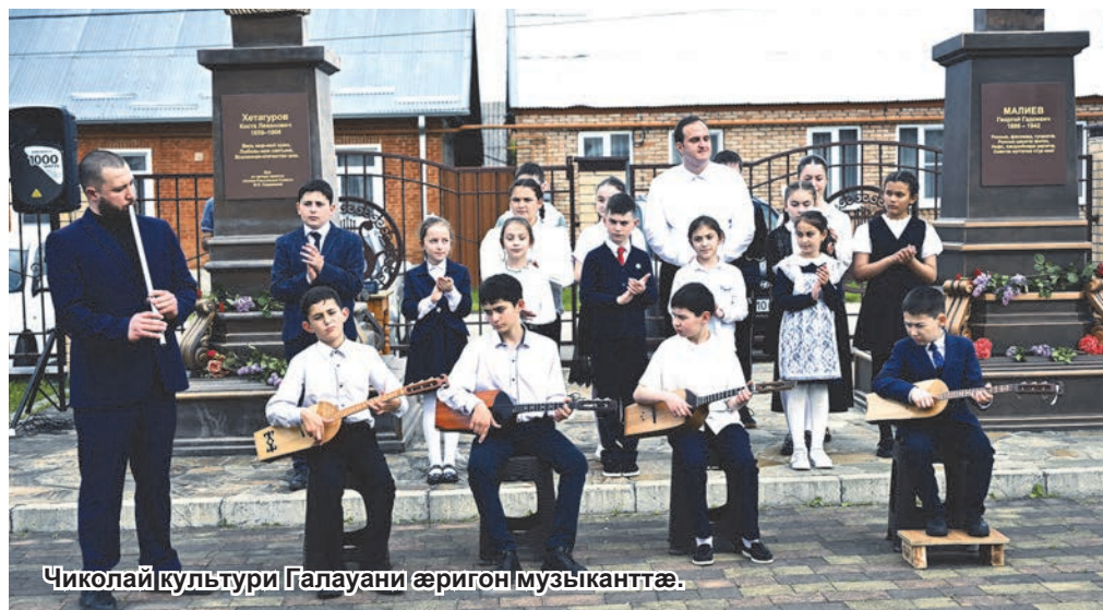
Чиколай культури Галауани аригон музыкантгэ.