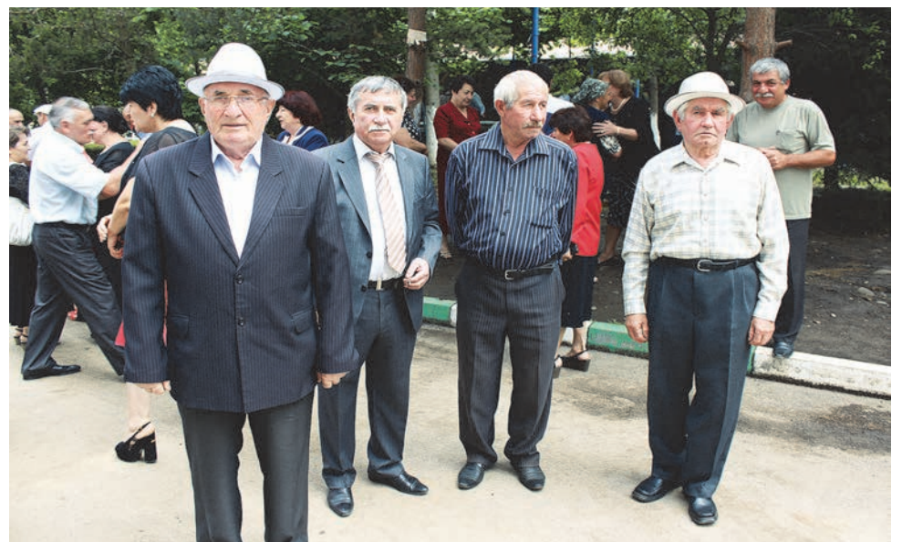
САКЪИТИ Сослэнбег хуэрзэгъдаудзийнадае уэлдай рэсугъддээрэй аема аен-хэастдээрэй исфедэууй муггаги алли цийнэдзийнадае дээр.

Альбинэе райста уэлдээр ахургон-ддзийнадае. Исгьомбэл кодта фурт Ру-стами. Минкьити уиндэе, сэе ходун куд аехцаеуэн фэаууй хэастэртэн, бабатэе аема нанатэн!.. Фал кэамэн ци загъдэуа, фидбилиз фэарсгэе нэе кэунуй, аенангъэл-ти фэезиннуй... Алцидээр хуарз цудэй, сабур цард, цийнэе кэнэе кэастэртэбэл. Фал цэамэддээр гасгэе уотэе рауадэй, аема гъаеуама ести зин бавзурстайуонцае Сакъи-ти цардбэллон бийнонтае дээр... 2004 анз 1 сентябрь... Куд иннэе сувэллэнттэе, уотэе Рустам дээр рандэйе сьолоамэе... Цийни надбэл бэаггэе фэаннэхстээр аеи, фал ин фидбилизи надбэл цуд рауадэй – еци бон сьолоай тургыи бэаггэбонмэе ка аерэм-бурд аеи, уони хэццэе е дээр бахаудтэй аелгьистаг цэамарти уацари... Аертэе бони – катай, зэардэе рэадэууй аендэмэе, ци хузи