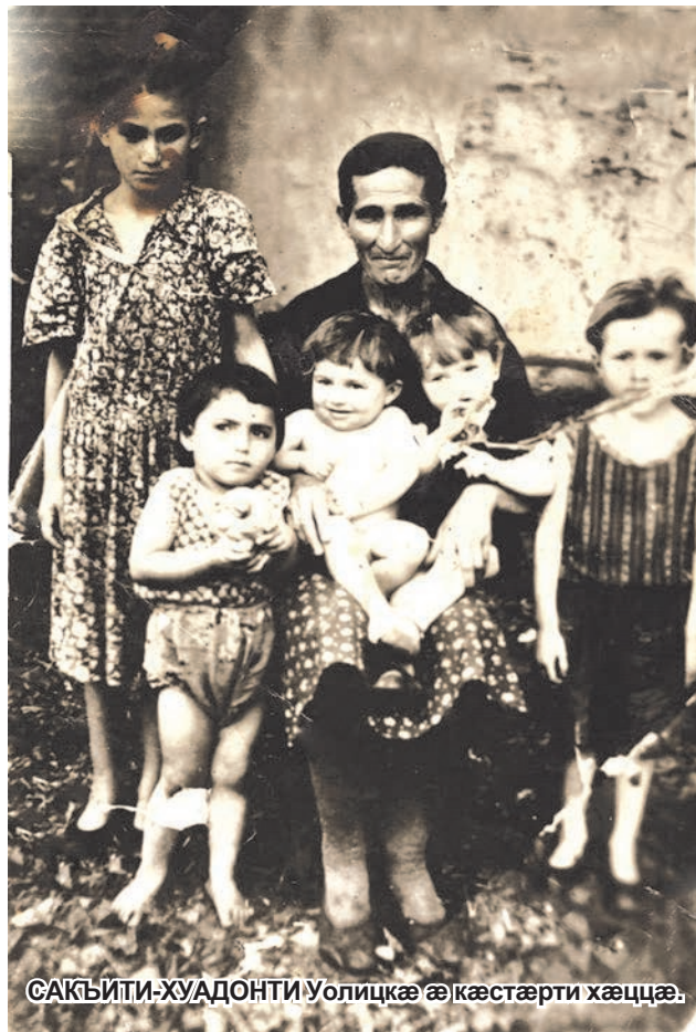
САКЪИТИ-ХУАДОНТИ Уолицкæ æ кæстæрти хæццæ.